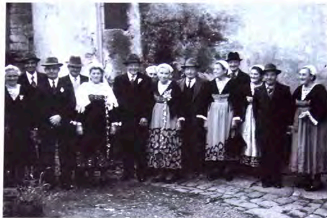
Chanteuses et chanteurs de Pluherlin (Morbihan)

C'est à Paris sur le petit pont ô lire lira lira la la Et lire lira lira la la l'y a t'une chapelle là Et lire lira lira la la l'y a t'une chapelle L'y a-t'un petit moine dedans Qui confesse les fillette Il en a confessé trois En refait la plus belle Pourquoi m'y retenez-vous Je n'suis point demoiselle Mon père y fait des sabots Et ma mère des écuëles C'est un petit frère que j'ai Les mène-t'-à La Rochelle Avec un petit cheval gris Qui file comme l'hirondelle Il a traversé le marais Sans donner d'coup de verge Quand il fut au bout du bois A donné coup de verge Le cheval il a buté A cassé les écuëles