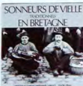
SCM004 Vol. I