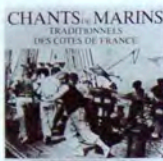
SCM001 Vol. I