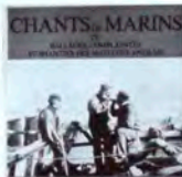
SCM005 Vol. IV