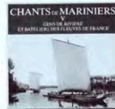
SCM007 Vol. V