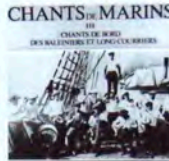
SCM003 Vol. III