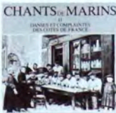
SCM002 Vol. II