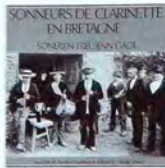
SCM008 Vol. II