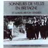
SCM010 Vol. III